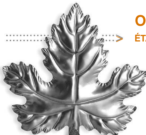
Métal non traité