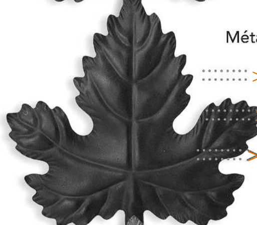
Métal rouillé, neutralisé, et protégé ROUILLANT FER 0857 NEUTRALISANT 0858 PROTECROUILLE mat 0861