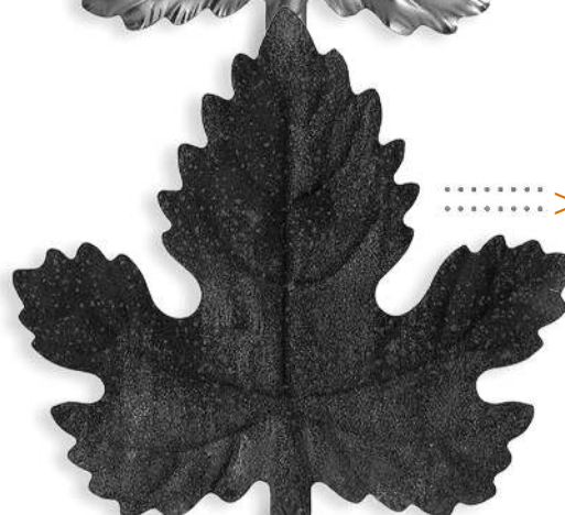
Métal rouillé, ROUILLANT FER 0857