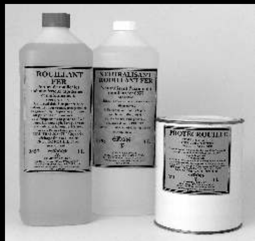
Le Rouillant Fer, le Neutralisant Rouillant Fer et le Protecrouille sont commercialisés dans une gamme de prix qui oscille entre 9 et 15 euros HT le litre.